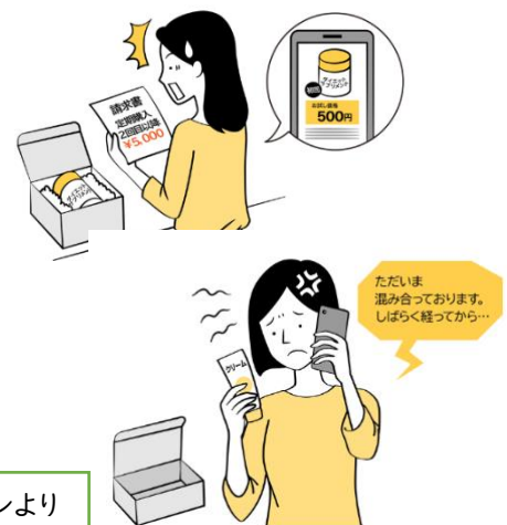
イラスト:政府広報オンラインより

SNSで初回980円のダイエットサプリの広告を見てクレジットカード払いで注文した。その後商品が届き、中身を確認したら6箱入っていて、代金も約2万円になっていた。1箱のみ980円で注文したつもりだったが、申し込む際に「期間限定クーポンプレゼント」を選択したことで、約2万円の商品が3か月ごとに届く定期購入になっていたようだ。次回以降は解約したいが、事業者の電話番号にかけてもつながらない。どうしたら解約できるか。