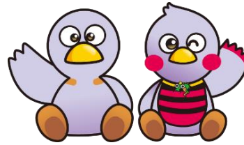
埼玉県マスコット「コバトン」「さいたまっち」

埼玉県からは消費生活課、埼玉県消費生活支援センターの計6人、なくす会からは理事長、専務理事、事務局の4人が出席し、ライフティに対する訴訟提起における対応などについての協議や互いの取り組みの情報交換を行いました。